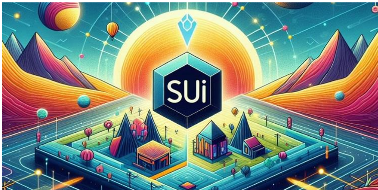
نقشه راه (Roadmap) و برنامه‌های آینده: SUI

پروژه SUI با ارائه زیرساخت‌های قدرتمند و توانایی پردازش تعداد زیادی تراکنش در ثانیه، جایگاه ویژه‌ای در حوزه دیفای و وب ۳ کسب کرده است. این بلاکچین با ارائه ویژگی‌هایی همچون سرعت بالا، توان عملیاتی زیاد و هزینه‌های پایین، به یکی از انتخاب‌های محبوب برای توسعه‌دهندگان تبدیل شده است. همچنین، SUI با ارائه یک محیط توسعه‌دهی کاربرپسند و ابزارهای متعدد، امکان سافت و اجرای قراردادهای هوشمند پیچیده را برای توسعه‌دهندگان فراهم می‌کند. این ویژگی‌ها به SUI این امکان را می‌دهد تا در حوزه دیفای و وب ۳ به عنوان یک زیرساخت اساسی و پر قدرت عمل کند.